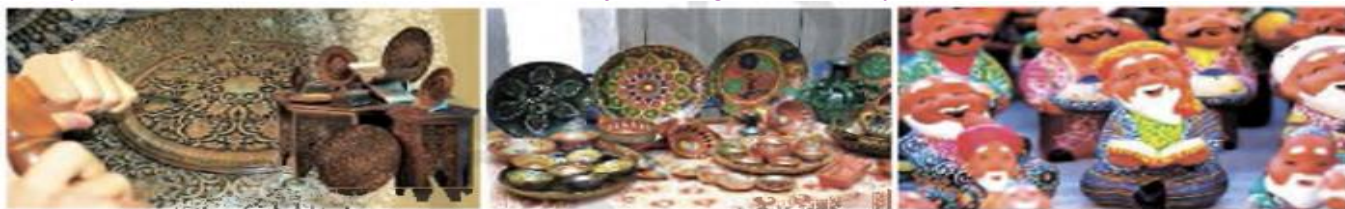
1-rasm. Xalq hunarmandlari ishlaridan namunalari.

Asrlar davomida orttirilgan va madaniy boyligimiz, xususan, sho‘ro tuzumi davrida o‘zbek milliy xalq amaliy bezak san‘atining eng ko‘p rivojlangan turlaridan ganchkorlik, naqqoshlik, yog‘och o‘ymakorligi, toshtaroshlik, suyak o‘ymakorligi, kandakorlik, pichoqchilik, zargarlik, kashtachilik, zardo‘zlik, gilamchilik kabi turlarning o‘ziga xos tomonlari, bajarish texnologiyasi, haqiqiy asl nomlari, o‘ziga xos maktablari, uslublarini yaratgan ustalarning nomlari asta-sekin yo‘qolib ketish xavfi ostida qoldi. Bugungi kunda mustaqil mamlakatimizda xalqimizning asrlar bo‘yi yaratgan mehnati natijasida yaratilgan amaliy bezak san‘atini ko‘z qorachig‘idek saqlash, qadrlash, ulardan amaliy foydalanish, yoshlarga o‘rgatish orqali ularning estetik didini o‘stirish hamda yuksak madaniyatli kishilar qilib tarbiyalash uchun keng imkoniyatlar ochildi. Abu Rayhon Beruniy, Abu Ali Ibn Sino, Al-Xorazmiy, Nizomiy Ganjaviy, Nosir Xisrav, Alisher Navoiy, Kamoliddin Behzod, Bobur kabi jahonga mashhur olim, shoir va musavviralar xalqimizni go‘zallikka intilishga chaqirgan. Bobomiz Amir Temur hunar va ilm egalari, yirik mutaxassis olimlar yordamiga tayanib matematika, geometriya, me‘morchilik, astronomiya, adabiyot, tilshunoslik, tarix, musiqa, tasviriy san‘at va hattotlik kabi san‘at asarlarini rivojlantirishga katta ahamiyat berdi.